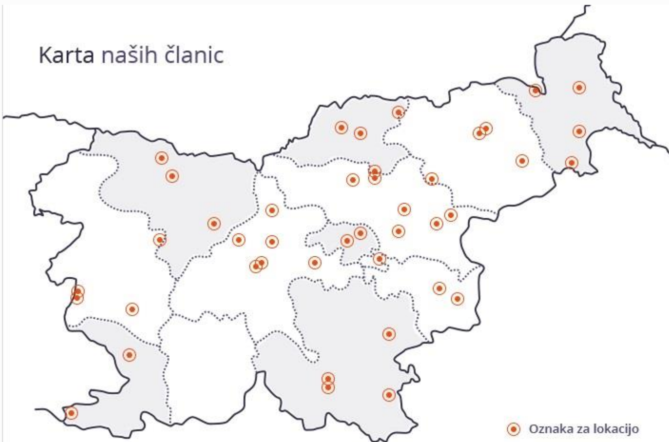
Karta naših članic